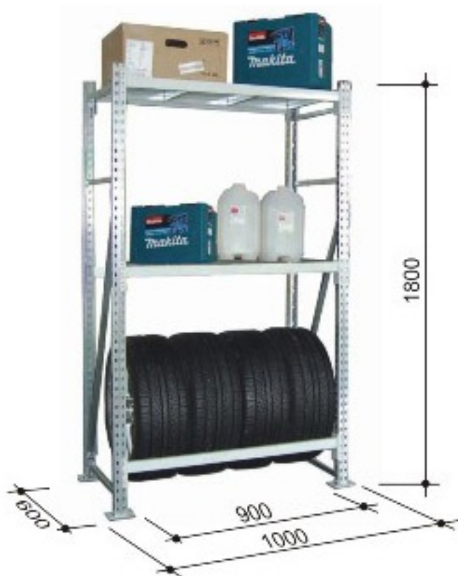
Наименование: Бытовой стеллаж с 3-мя ярусами. Материал: сталь. Грузоподъемность: 1200 кг. Размеры: 1000x600x1800 мм.